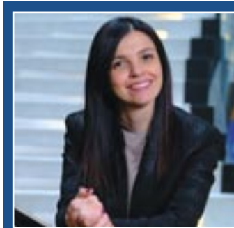
ON. FRANCESCA PEPPUCCI Membro del Parlamento Europeo

«Sto parlando della Legge sul Ripristino della natura - dice l'On. Francesca Peppucci (FI-Gruppo PPE) - una legge fortemente voluta e votata dalla sinistra; in particolare si chiede di ripristinare gli ecosistemi inquinanti e inquinati, con provvedimenti che riteniamo sproporzionati per raggiungere gli obiettivi ambientali e che rischiano di mettere in difficoltà il fabbisogno alimentare dell'Unione Europea. Non possiamo permetterci ulteriormente di preferire prodotti extra UE che non rispettano i parametri di qualità dei nostri, e che, entrando nel mercato ad un prezzo evidentemente più basso, sfavoriscono il Made in Italy e il lavoro dei nostri produttori».